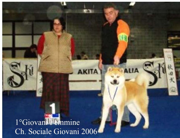
1° Giovani Femmine Ch. Sociale Giovani 2006