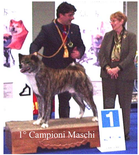
1° Campioni Maschi