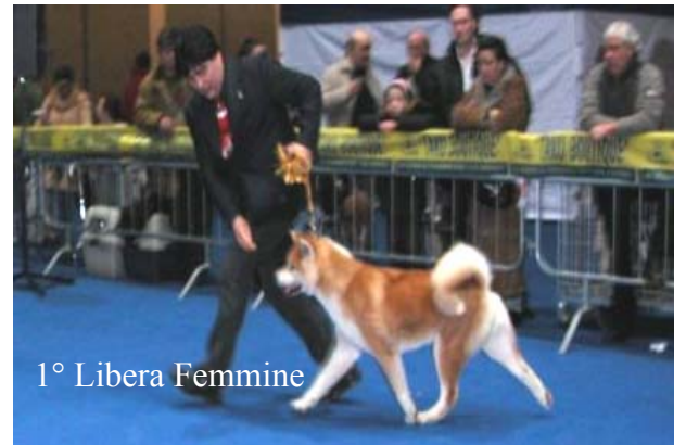
1° Libera Femmine