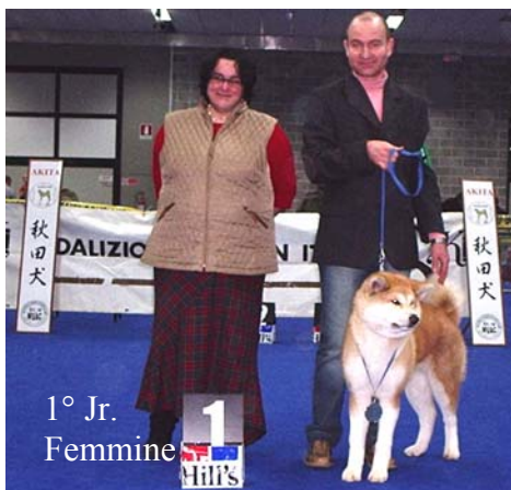
1° Jr. Femmine