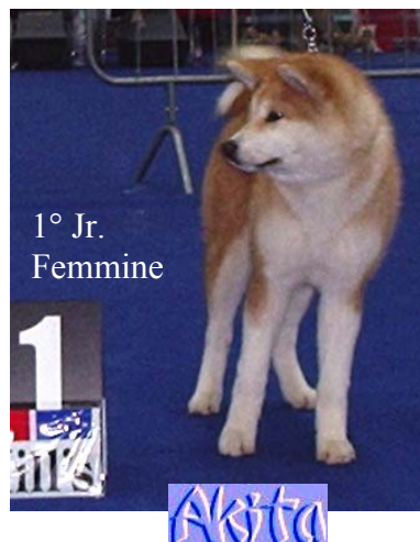
1° Jr. Femmine