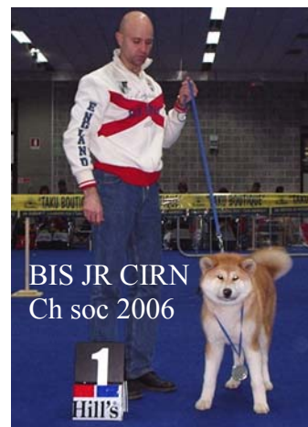
BIS JR CIRN Ch soc 2006