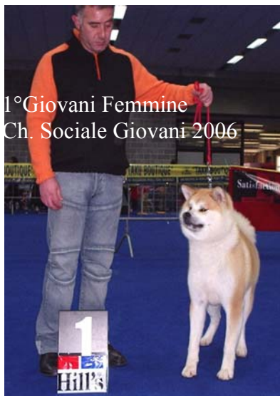
1° Giovani Femmine Ch. Sociale Giovani 2006