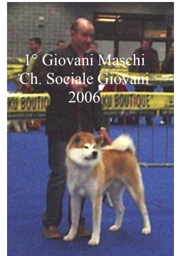
1° Giovani Maschi Ch. Sociale Giovani 2006