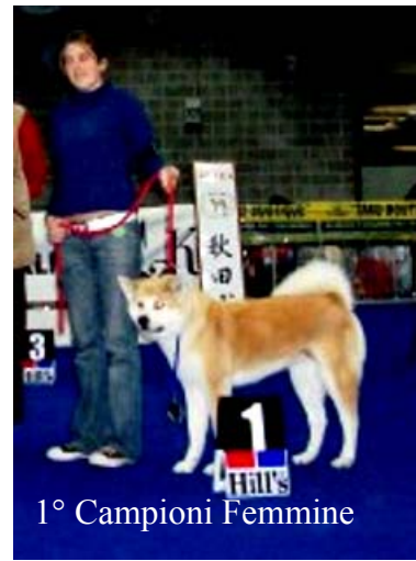
1° Campioni Femmine